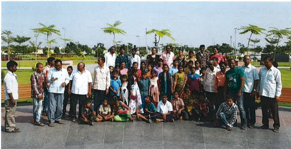
Alla samlade vid vårt unika besök i nya regionala huvudstaden.