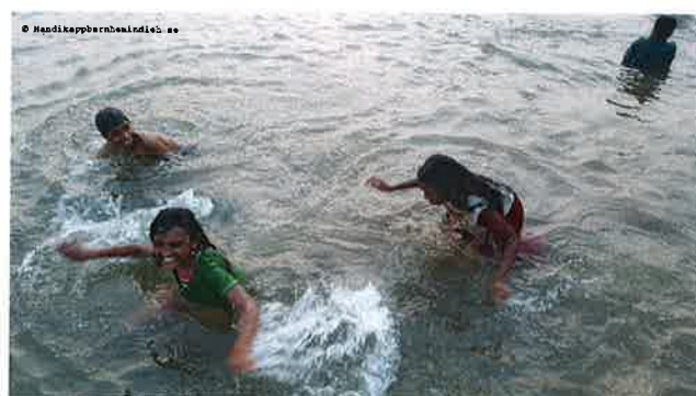
Barnen badar i Krishna river

Antalet månadsgivare har under året varierat något kring 100 personer.